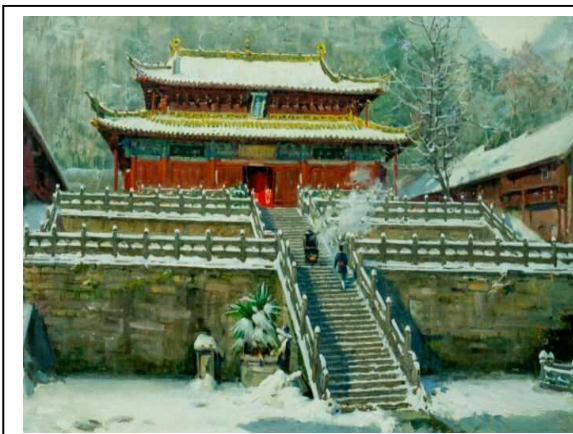
Monasterio de Shaolin, de orientación budista, en Henan y Monasterio Zi Xia, de orientación taoísta, en las montañas de Wu Dang