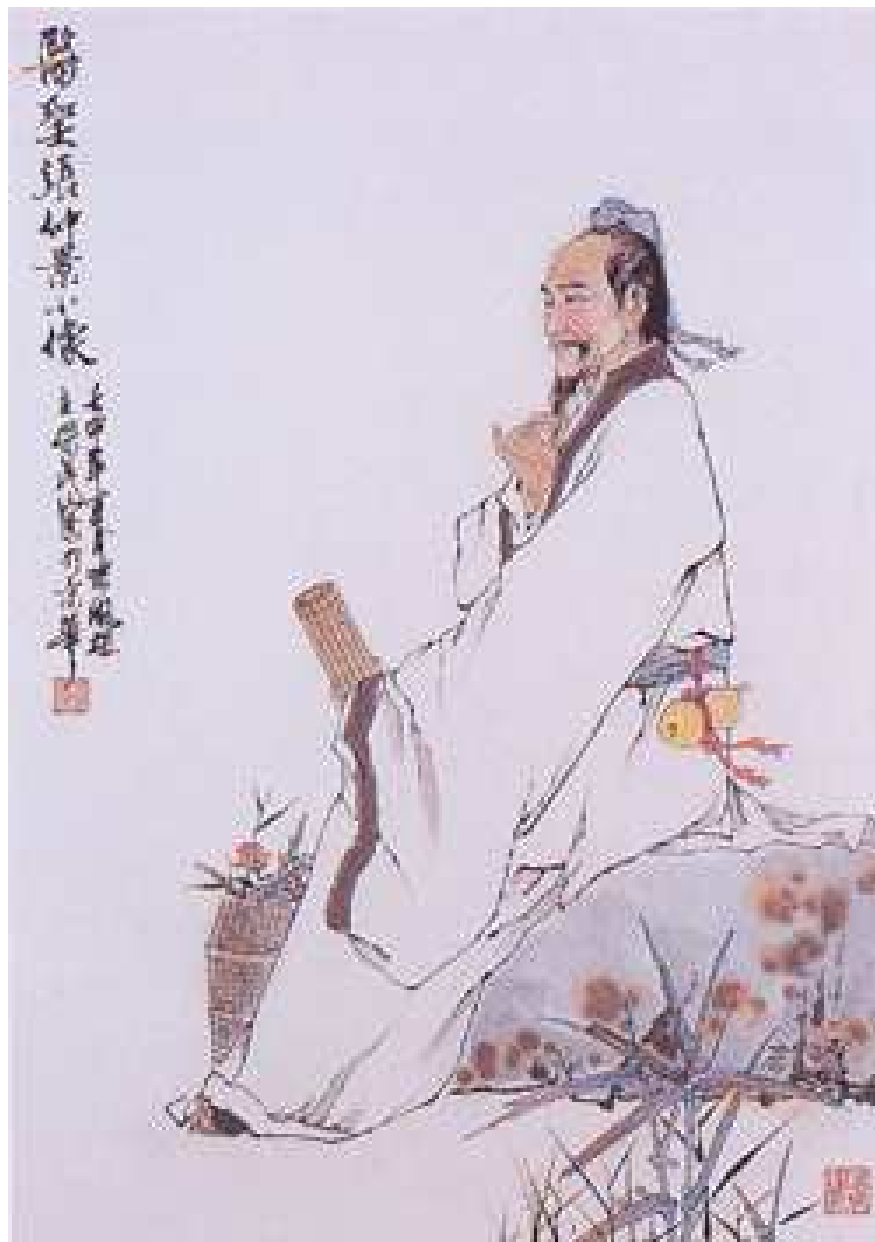
Representación alegórica de hombre virtuoso

Lo singular de este proceso, es que consiguieron conectar la esfera física con la espiritual a través de la respiración y la meditación, ya fuese en movimiento [dinámica ( Yang )] o inerte [estática ( Yin )], configurando métodos metafísicos o cercanos a la ciencia de la época para conseguir resultados observables, detectables, previsibles y diagnosticables por la Medicina Tradicional China [MTC], que durante milenios se ha destacado como único método fiable para eliminar el padecimiento, las patologías y la enfermedad, promoviendo la mejora de la salud de millones de personas en el continente asiático, sin dejar de lado el objetivo de alcanzar una mayor seguridad personal con las actividades de lucha tradicionales y la formación de hombres íntegros, éticos y virtuosos.