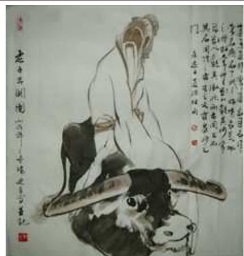
Lao Tse viajando sobre el búfalo

De acuerdo con esta tradición el fundador de esta corriente es Lao Tsé [ Laozi ], que partió hacia el oeste [actual Tibet] a lomos de un búfalo para meditar sobre la condición humana y sobre el universo que nos rodea. Durante su retiro redactó el Tao Te King [ Daodejing ] o Libro de la vida y la virtud , donde se indica que el Tao es el principio fundador del universo; la fuerza [ prana en sánscrito, chi en chino y ki en japonés] que rige la naturaleza es la misma que nos anima, somos una parcela de este universo y él es una parte de nosotros; el microcosmos y el macrocosmos son uno solo.