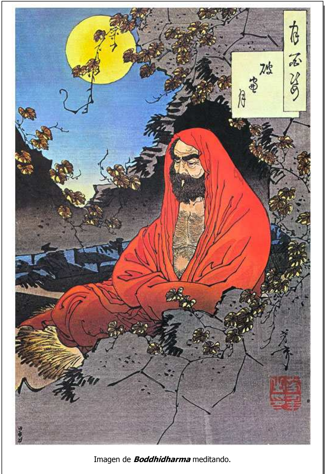
Imagen de Bodhidharma meditando.

Por lo tanto, éste era el mensaje prístino, de pastoral Mahayana, el que pretendió transmitir el monje Bodhidharma [también conocido por Da Mo en chino y Daruma en japonés], perteneciente a la casta de los Kashatriya [príncipes y guerreros] y conocedor de formas sofisticadas de combate, como el Nata y el Vajramushiti.