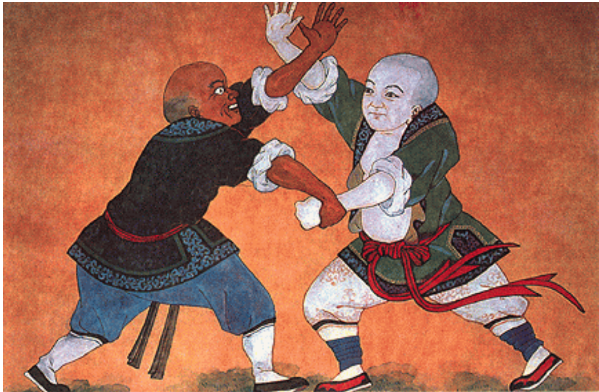
Reproducción de monjes Shaolin, practicando ejercicios de defensa y ataque

El sistema practicado por los monjes de Shaolin estaba basado en el fortalecimiento y endurecimiento físico, el desarrollo de las capacidades físicas básicas, así como las motrices, y el fortalecimiento espiritual y filosófico.